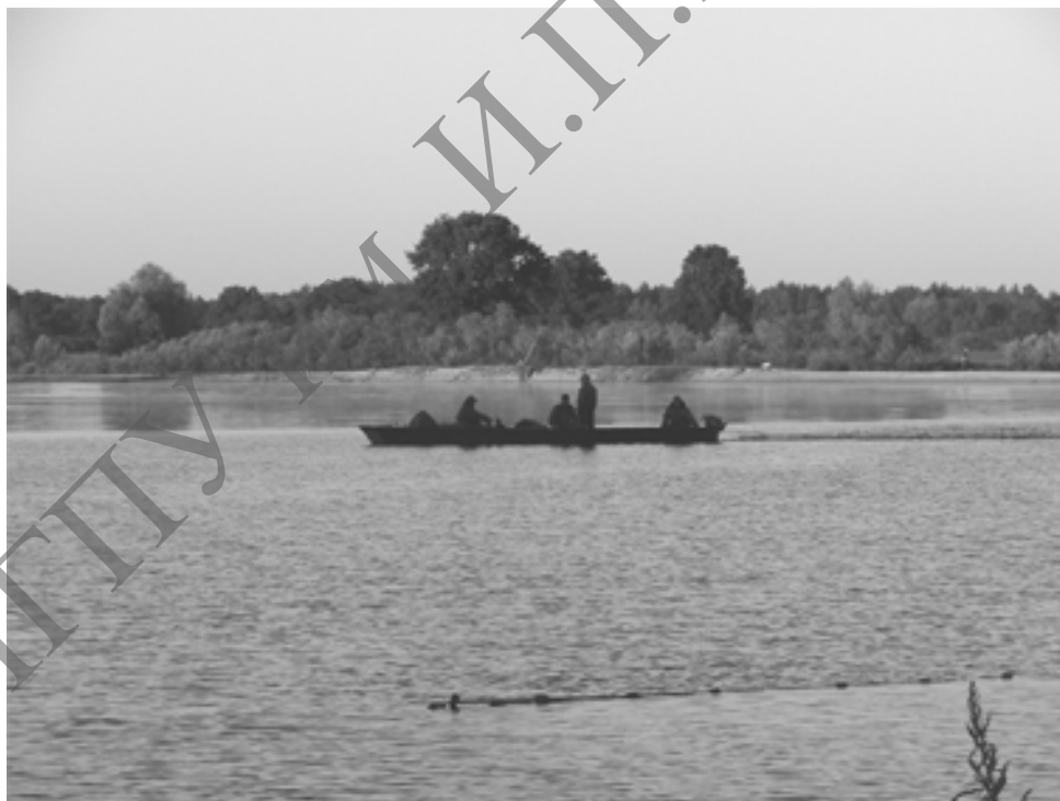
Рисунок 2 – Старое русло р. Припять, участок № 1, неводной лов