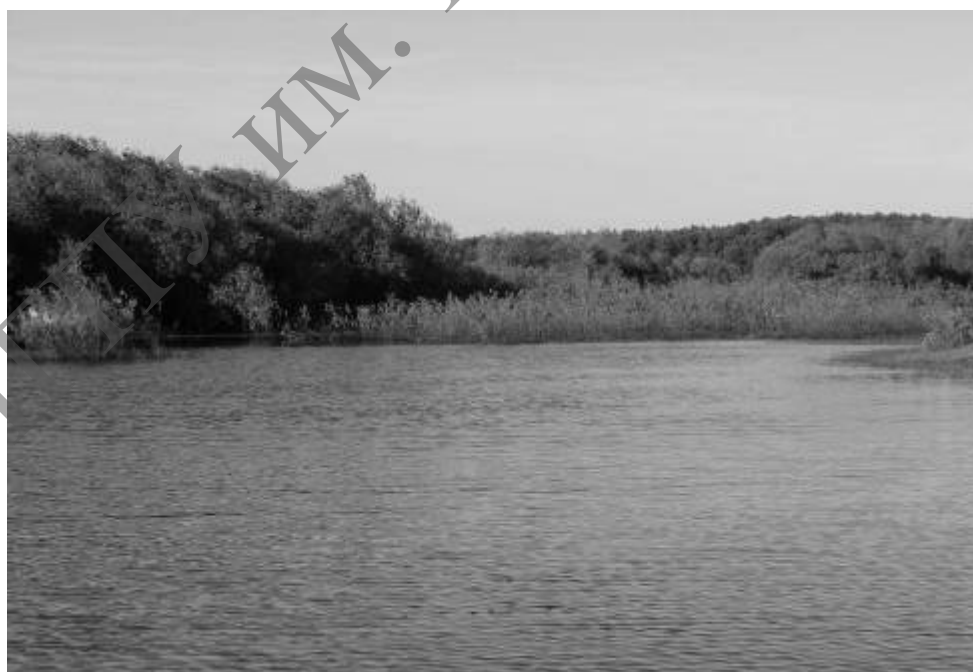
Рисунок 4 – Устье р. Тур, участок № 3, сетной лов