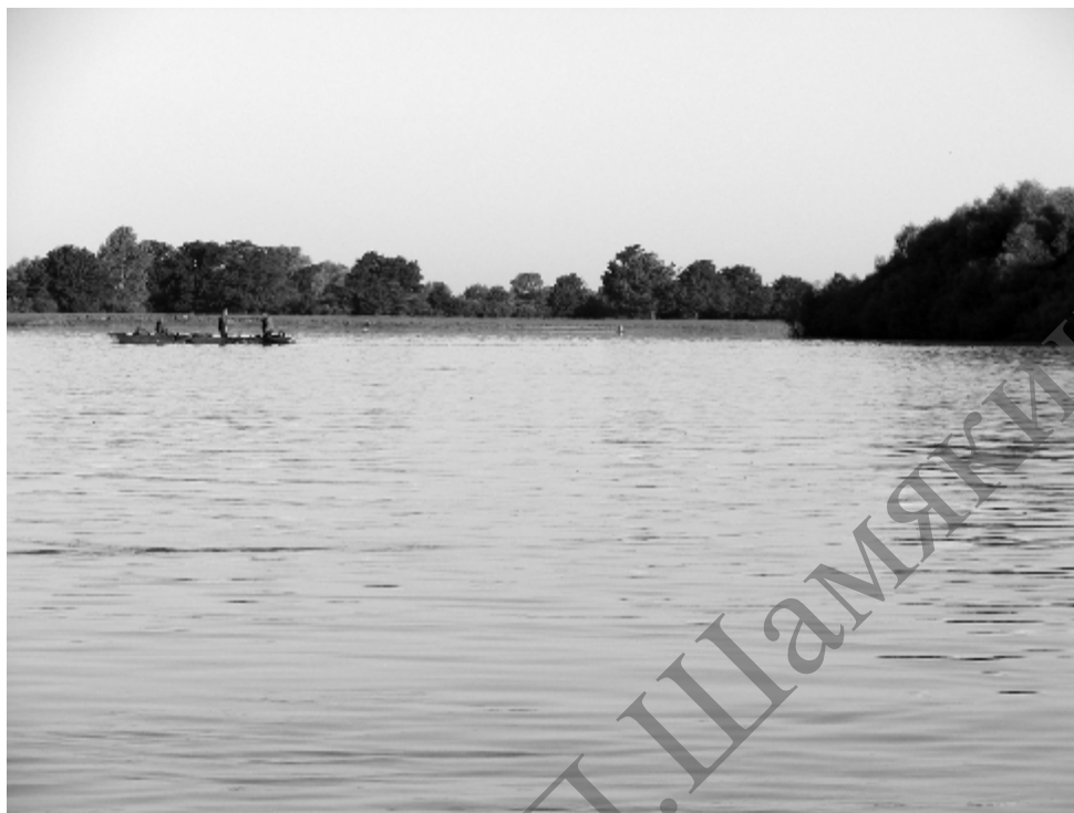
Рисунок 3 – Русло р. Припять, участок № 2, неводной лов