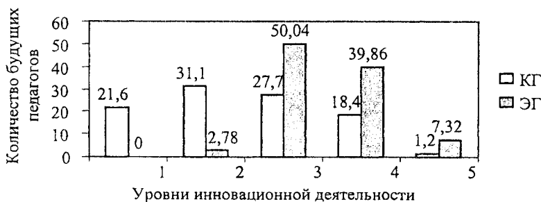
Рис. 2. Распределение будущих педагогов по уровням сформированности системы инновационных умений

По результатам количественной оценки можно сделать предварительный вывод о том, что будущие педагоги экспериментальных групп обладают более глубокими знаниями инновационной области и лучше овладели инновационными умениями.