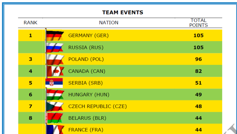
Рисунок 4 – Результаты чемпионата мира по гребле на байдарках и каноэ 2013 года (Дуйсбург, Германия)