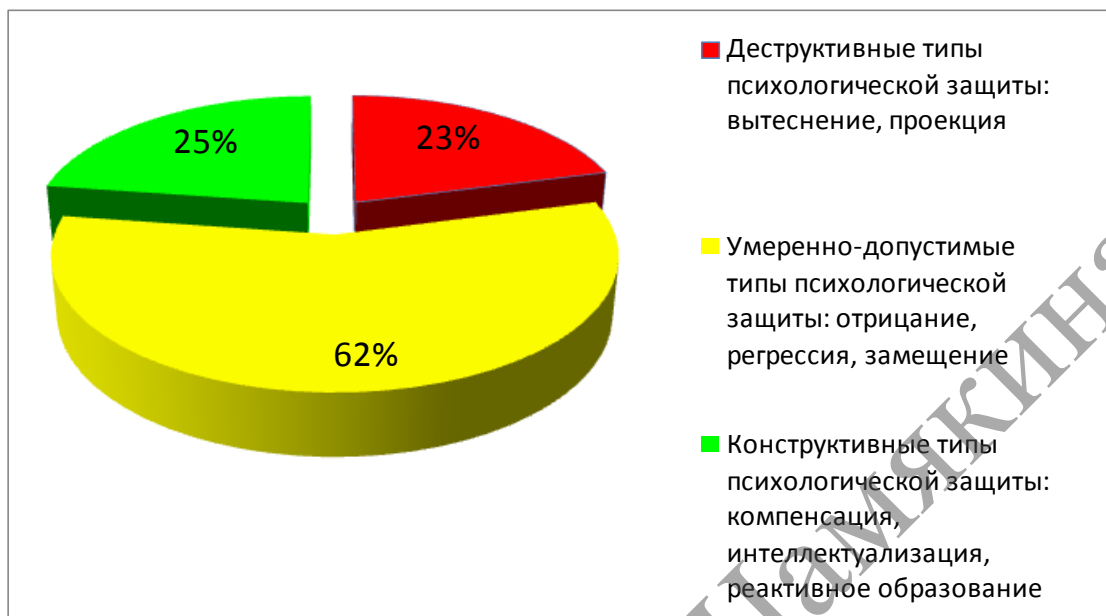
Рисунок 2 – Значимость профиля психологической защиты

Распределение вариантов психологических защит по профилю представлено на рисунке 2.